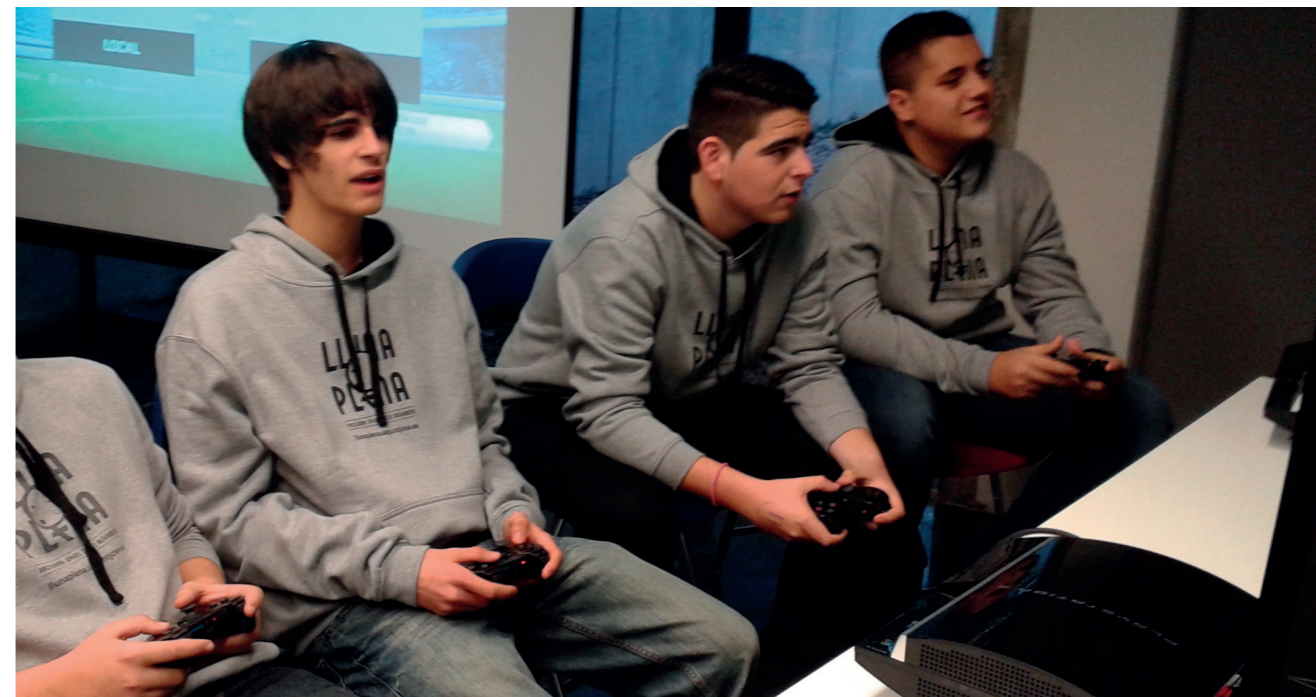
Jugant al torneig FIFA 14. Lluna Plena 31 de gener.