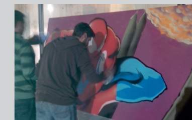
Taller tatuatge de henna, Sopar Solidaria, Exhibició de graffiti.

CASAL JOVE C/ Vent de Marinada, s/n Port de Sagunt Tel. 96 268 34 39 www.saguntjove.es