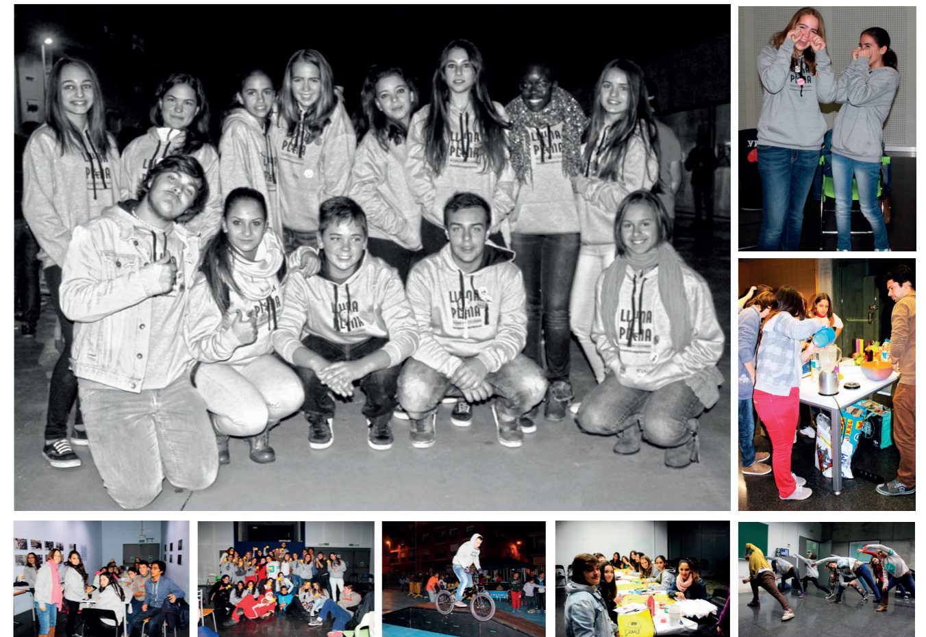
Selecció d'imatges del Programa d'oci alternatiu "Lluna Plena" al Casal Jove 29 de novembre de 2013.

La revista JoveNews és la revista que els Corresponsals del Casal en els Instituts realitzen per posar-nos al dia de les activitats que es duen a terme tant a l'IES com al Casal Jove. Així, podreu veure entrevistes a companys o professors, excursions, activitats al Casal, cartes al director de l'IES... Ah! I per cert, qui vullga pot participar a la revista. Només ha de dir-ho als corresponsals del seu IES. Els coneixereu a l'interior de la revista i al twitter @CorrpsonsCajo14